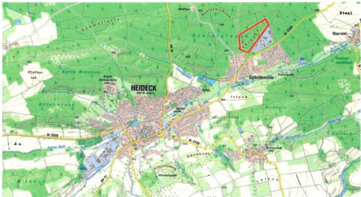
Abbildung 1: Lage des geplanten Gewerbegebietes im Norden von Seiboldsmühle (Ausschnitt aus der TK25, ohne Maßstab)

Der Stadtrat hat in seiner öffentlichen Sitzung vom 28.11.2023 den Entwurf der 16. Änderung des Flächennutzungsplanes „Erweiterung Gewerbegebiet Kohlbeck“ gebilligt.