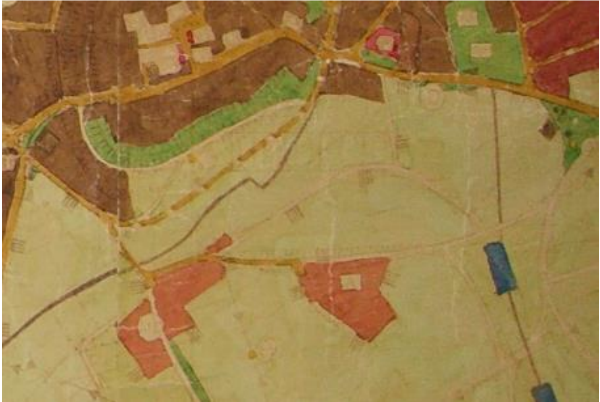
Abbildung 2: Auszug aus dem rechtswirksamen Flächennutzungsplan der Stadt Heideck, ohne Maßstab