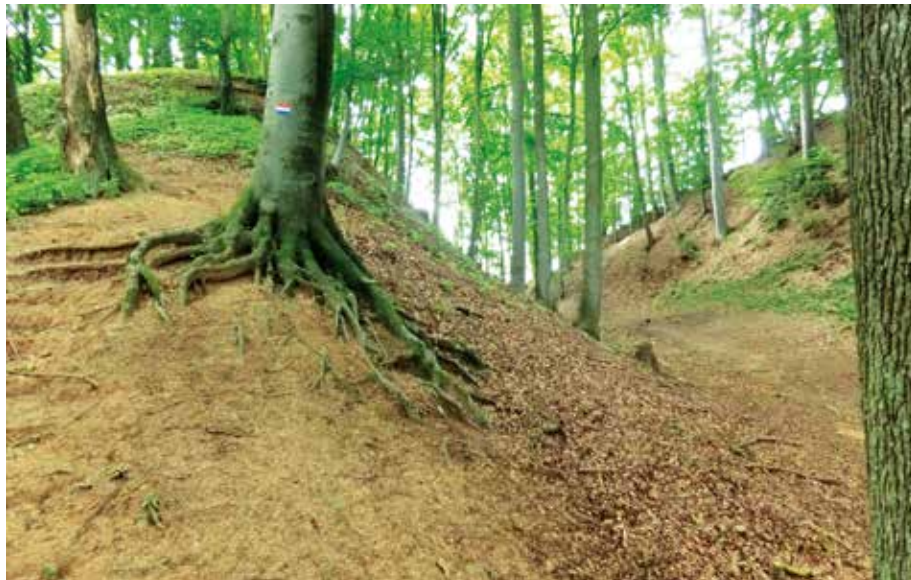
Die tiefen Gräben um die ehemalige Burg auf dem Heidecker Schlossberg werden mit dem Heidecker Burgenweg erwandert.

Zum Abschluss gab es den von allen Teilnehmern gewünschten Stempel im Heidecker Wanderpass. Hier sind die weiteren Wanderangebote für 2019 vermerkt. Wer die Teilnahme an vier Führungen nachweisen kann, hat Aussicht auf den Gewinn eines Preises der Stadt Heideck.