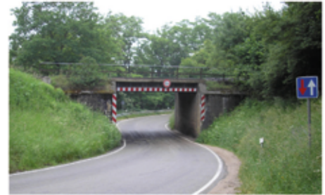
Höhenbeschränkte Bahnunterführung auf der St 2224 zwischen Georgensgmünd und Pleinfeld.

Aufgrund der Komplettsperrung der St 2223 empfehlen wir dem Schwerlastverkehr aus Georgensgmünd in Richtung Nürnberg die Ausweichroute über Roth. In Richtung Augsburg wird während der gleichzeitigen Sperrung der B2 vom 11. März – 18. April die Ausweichroute über Spalt und die B466 empfohlen. Nach Ablauf der Sperrung der B2, am 19.04.2019, kann der Schwerverkehr über die Anschlussstelle Kiliansdorf auf die B2 in Richtung Augsburg fahren.