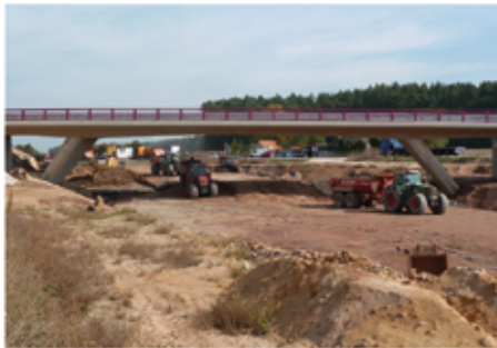
Blick auf die Baustelle B2 bei Wernsbach

Die Ortsumfahrung bei Wernsbach stellt einen wichtigen Lückenschluss im Gesamtausbau der B2 dar. Die Ortsumfahrung sorgt aber nicht nur für besseren Verkehrsfluss auf der B2, sondern entlastet Wernsbach vom Durchgangsverkehr und bringt Sicherheit und Lebensqualität in den Ort zurück. Die Brückenbauwerken sind nahezu fertiggestellt. Aktuell stehen die Verbindungsstellen der Ortsumfahrung mit der bestehenden B2 im Fokus.