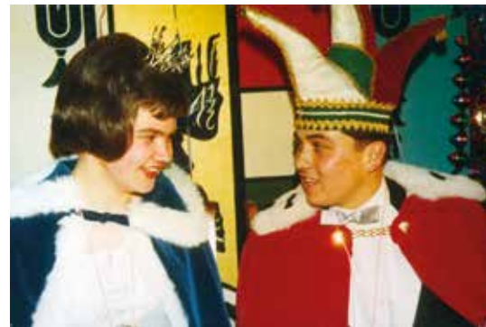
Prinzessin Gerlinde und Prinz Günter, 1966.