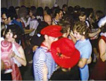
Ball der Feuerwehr, 1972.