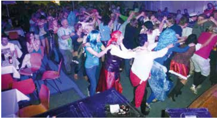
Geselligkeitsverein, 2014, unten 2018.