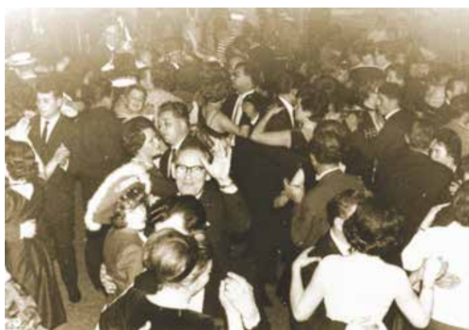
Der Stadtball war ein Schwarzweiß-Ball, 1964.