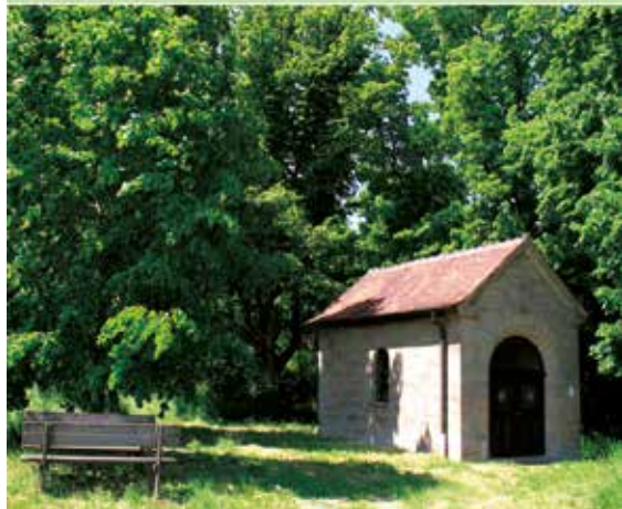
Bild eines frommen Soldaten und tapferen Eremiten

Die Wiederbelebung der Einsiedelei auf dem Kappelsberg ist in Verbindung mit dem Aufblühen des Eremitentums im katholischen Bayern im 17. und 18. Jahrhundert zu sehen. Erstmals lernte damals die einfache Bevölkerung Lesen und Schreiben durch die Einführung der Schulpflicht (in Laibstadt gab es zum Beispiel erst ab 1600 eine Dorfschule!). In dieser Zeit kamen „Erbauungsbücher“ durch kostengünstige Drucke auf den Markt, die reisenden Absatz fanden. Neben Bibel und Katechismus waren Heiligenlegenden und die so genannten Vätersprüche aus der Tradition der ägyptischen Wüstenmönche des 4. Jahrhunderts wichtige religiöse