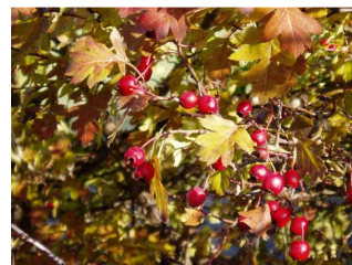
Weißdorn Farbe, Schutz &amp; Frucht