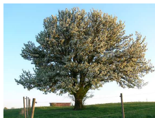
Birnenblütenpracht im April