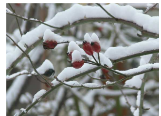
Hundsrose mit Winterschmuck